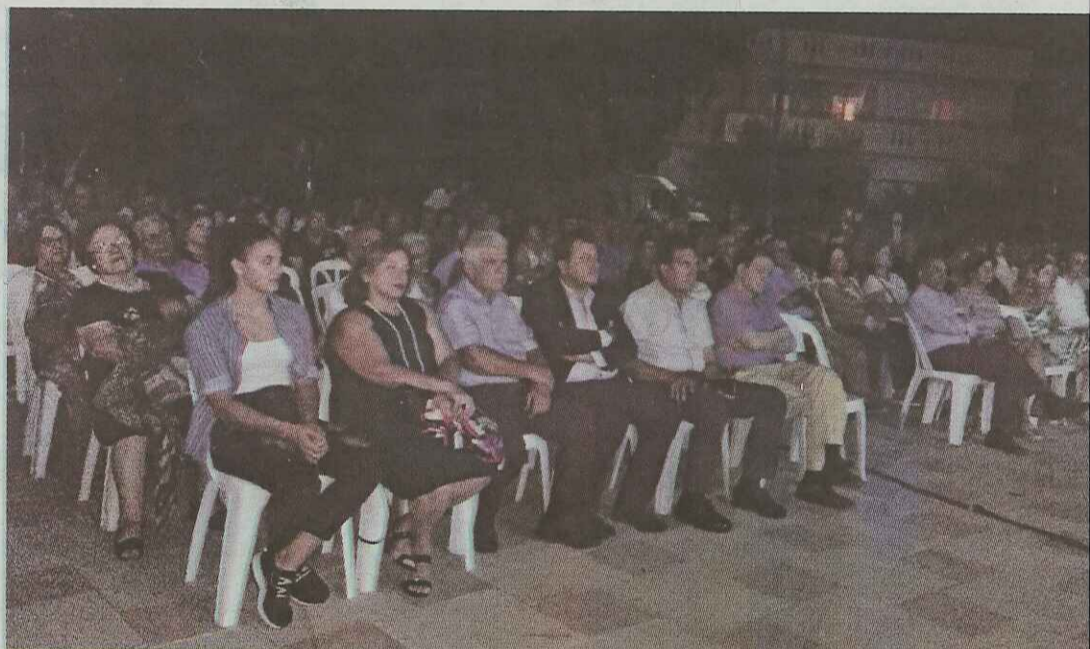
Πλήθος κόσμου ανταποκρίθηκε στο κάλεσμα της "Πολιτείας Τυμπακίου" και συγκεντρώθηκε στο προαύλιο του Ιερού Ναού του Αγίου Τίτου, στο Τυμπάκι.

Σύμφωνα με τον Μανόλη Γλέζο, «το Τυμπάκι, με την ολοσχερή καταστροφή του, την καταναγκαστική εργασία στην οποία υποβλήθηκαν οι κάτοικοί του, τα μαρτύρια τα οποία υπέφεραν, την αντίστασή τους στον κατακτητή, αποτέλεσε σύμβολο Αντίστασης και Αγώνα. Σύμβολο εθνικό, ευρωπαϊκό και οικουμενικό».