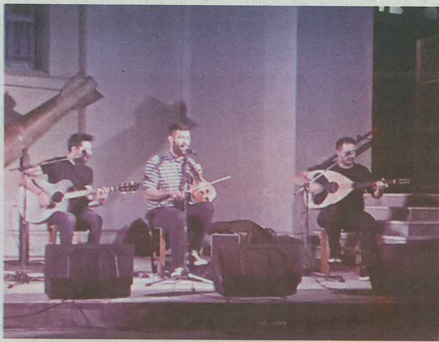
Την εκδήλωση έκλεισαν μουσικά οι μελωδίες των Γιώργου Πατεράκη, Ανδρέα Δερμιτζάκη και Γιώργου Ρασούλη.