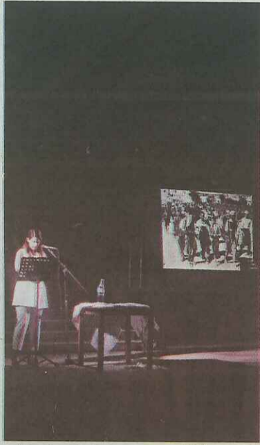
Κατά τη διάρκεια της εκδήλωσης, προβλήθηκε βίντεο με ιστορικές μαρτυρίες.